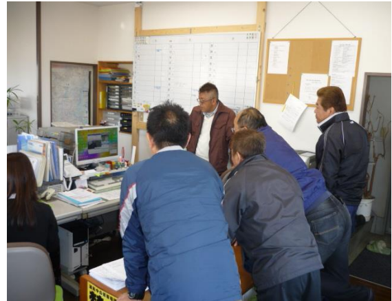
ドライブレコーダー教育