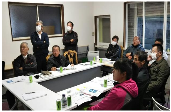
安全運転に関する社内研修