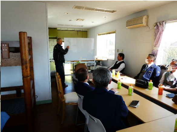
安全運転に関する社内研修