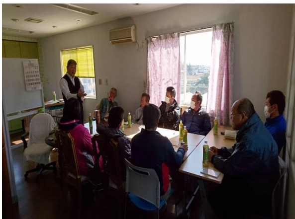
安全運転に関する社内研修