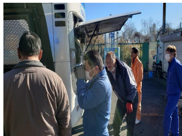
車両点検整備講習